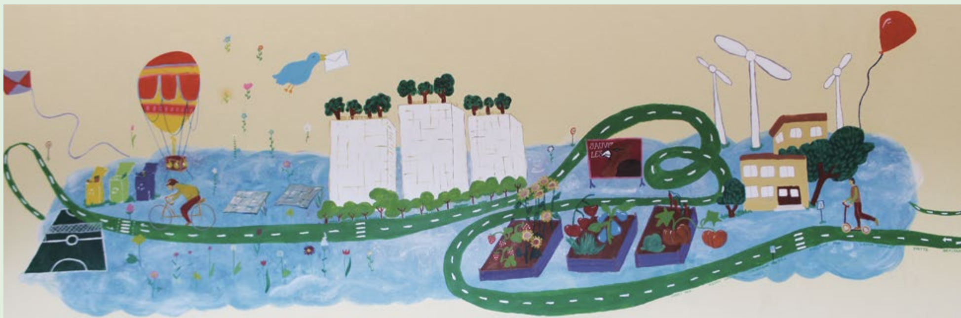
Première fresque - Collège Jules Ferry

Coup de chapeau pour l'antenne de Woippy du CMSEA (Comité mosellan de Sauvegarde de l'Enfance et de l'Adolescence) qui, sous la houlette de ses éducateurs spécialisés, a décoré la ville de fresques peintes avec des enfants, adolescents et jeunes adultes.