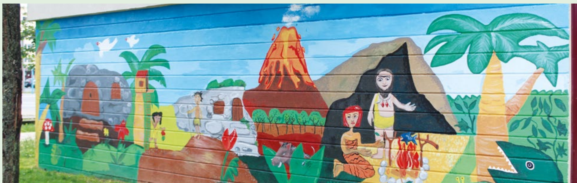
Troisième fresque - École Jacques Yves Cousteau