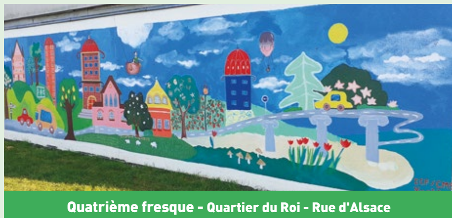
Quatrième fresque - Quartier du Roi - Rue d'Alsace