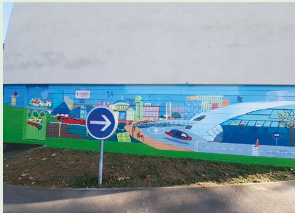
Cinquième fresque - Quartier du Roi - En face de l'Atrium