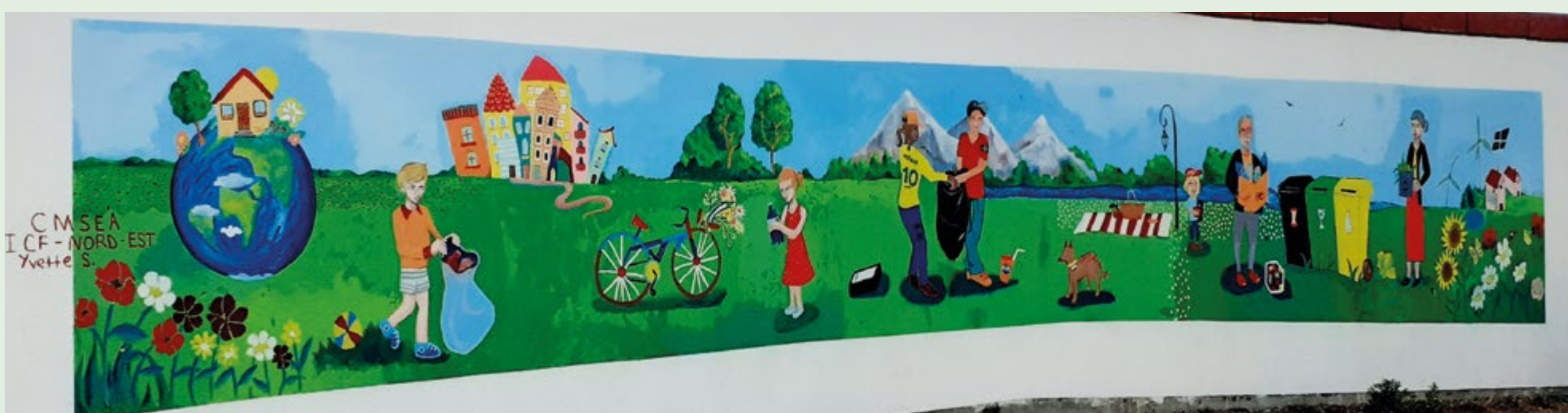
Septième fresque - Quartier du Roi - Rue d'Alsace - Garage