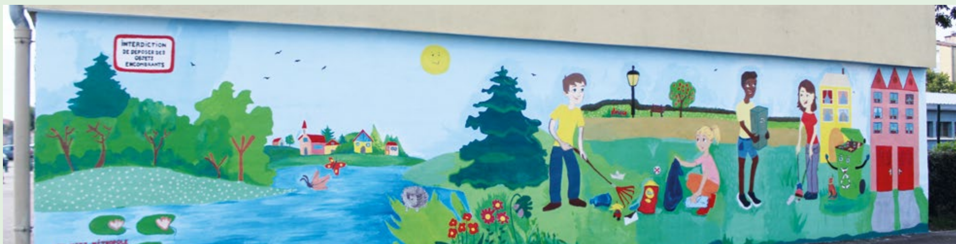
Fresque de la rue du Chapitre