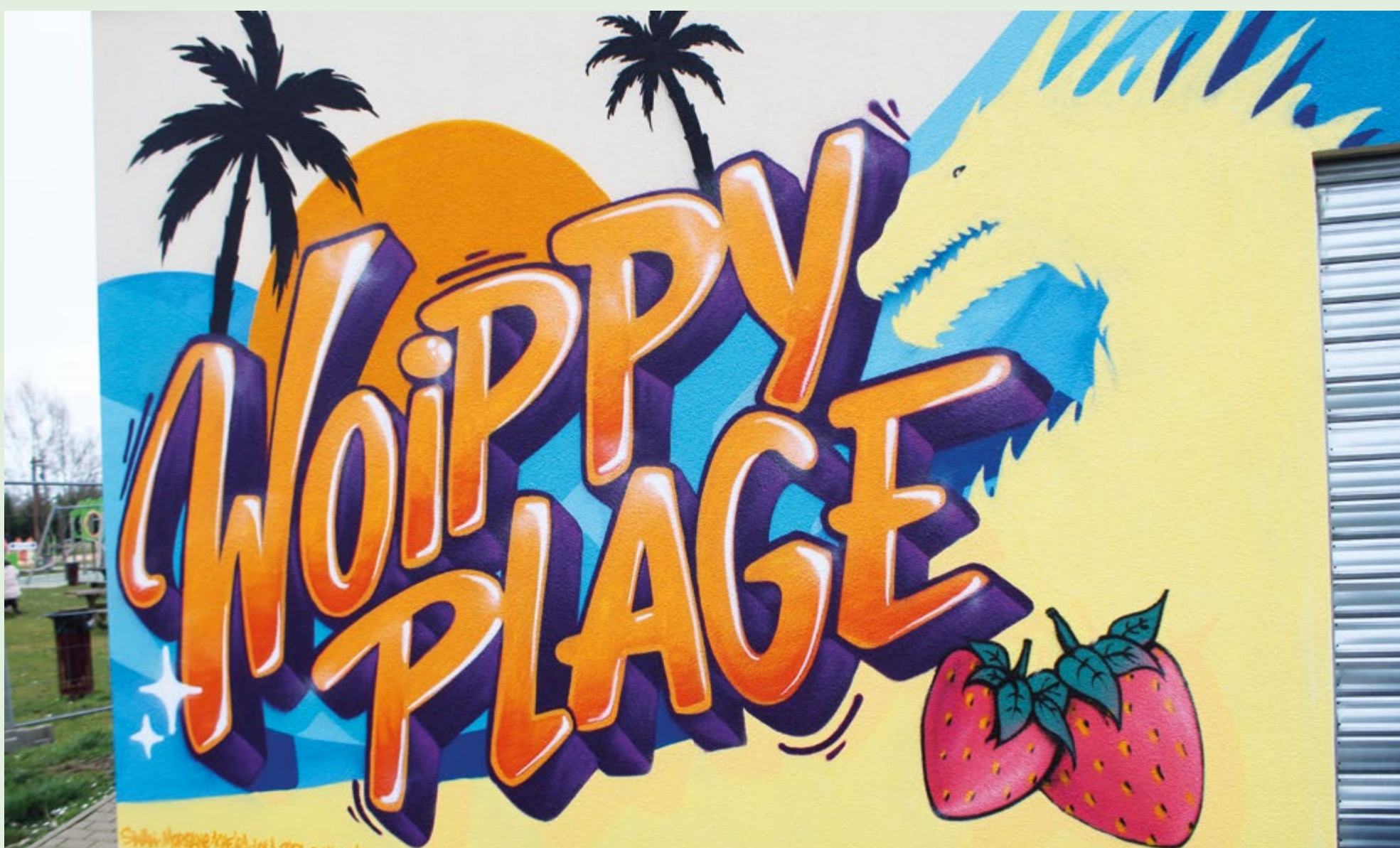
Huitième fresque à Woippy Plage