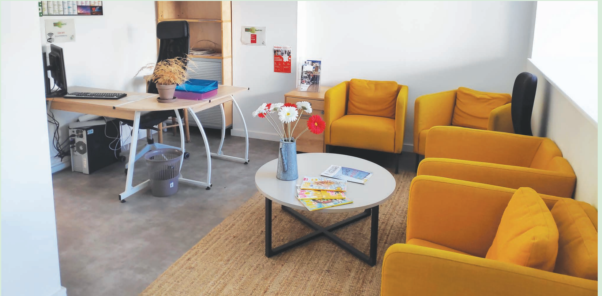
Les Repair Cafés sont un lieu convivial et d'échange. Comme ici au local de la MJC des quatre Bornes situé rue du Général Morlot et accueillant les ateliers du Brico-Borne.

La ville de Woippy a adopté le concept avec différentes variantes.